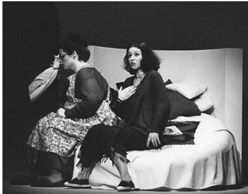
Die Ruhe selbst: Maharishi