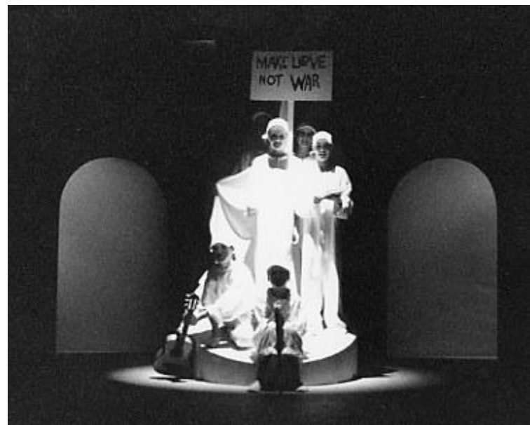
Auch ein Gruppenfoto darf nicht fehlen