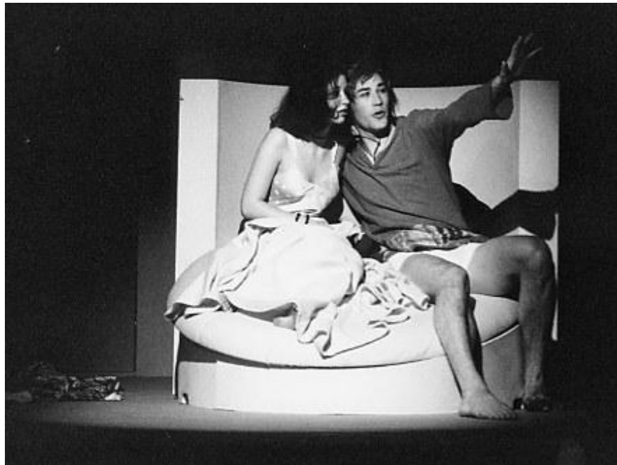
geheimnisvoll wird das Stück eröffnet